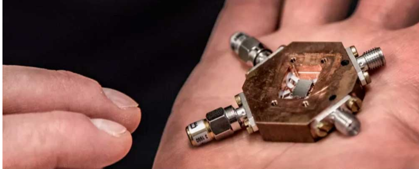
Den svenska kvantdatoren byggs av supraledande kvantbitar, elektriska kretsar på ett mikrochip som försätter enstaka fotoner i kvanttillstånd.